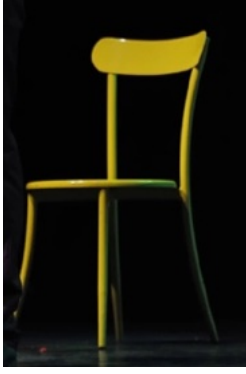
كرسي حديد او خشبي الكمية : 2