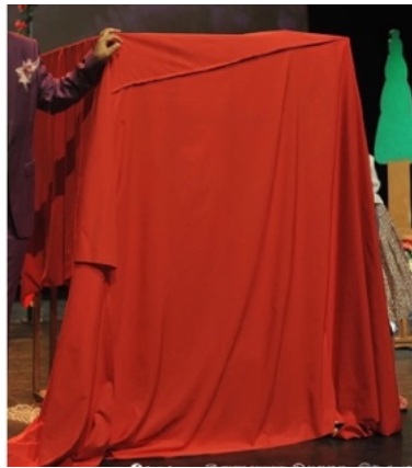
قطعة قماشية لتغطية القفص الحجم : 4,5x4,5م