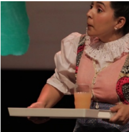
طبق لتقديم الطعام