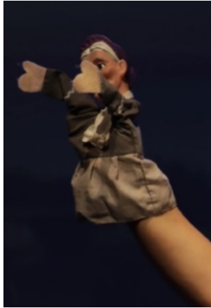
دمية يدوية صغيرة