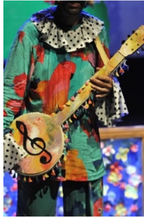
آلة موسيقية خشبية