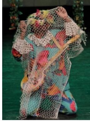
شبكة صيد اللون: ابيض الحجم : 4x4م