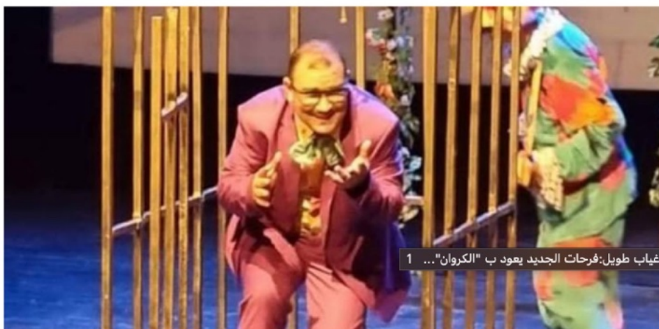
بعد غياب طويل:فرحات الجديد يعود بـ "الكروان" ... 1

11 يوليو 2024 14:23 in أخبار مهمة, ثقافة — by Univers News