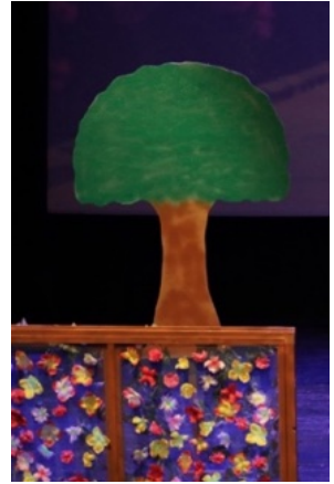
مجسم خشبي لشجرة و ازهار الكمية : 2 الحجم : 1,5م