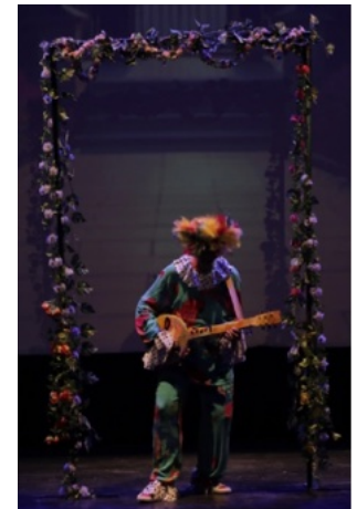
اطار حديدي مغلف بالازهار الحجم : 1,5x2,5م